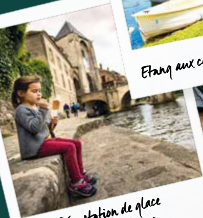
Dégustation de glace au bord du Loing