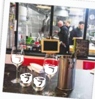
Bistro de la Grande Maison