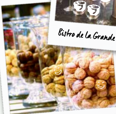
Macarons de Réau