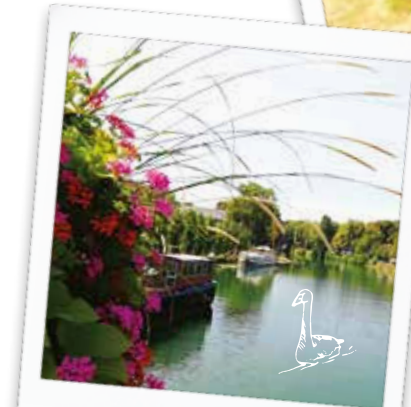
Balade en bord de Seine & croisière