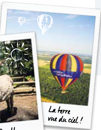
La terre vue du ciel !