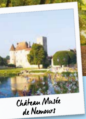
Château Musée de Nemours