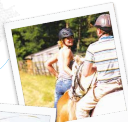
Rando à cheval