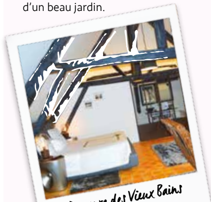
Demeure des Vieux Bains

Un lieu magique créé par Véronique dans les anciens bains publics de la ville, idéalement situé aux pieds des monuments. Vous apprécierez leurs chambres confortables mais également le petit-déjeuner copieux sur la terrasse d'un beau jardin.