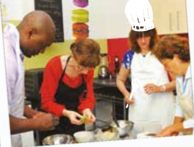
Atelier Cuisine Les Tabliers Gourmands