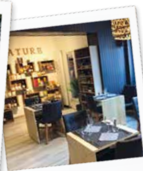
Un goût de nature