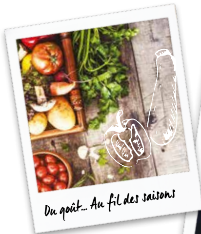
Du goût... Au fil des saisons

Cet établissement bien connu des environs est tenu par la famille Castaings depuis 70 ans. Il propose une cuisine traditionnelle mais en constante innovation à partir de produits locaux et de saison.