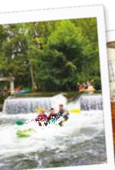
Activités au top !

Le soleil se reflète sur la Seine, un marché s'installe au bord de l'eau, l'effervescence fourmille autour des étales bien fournies, c'est une balade dominicale parfaite qui s'annonce ! Une pause sur une terrasse de café, un panier bien garni de fruits et légumes des producteurs locaux, ça donne envie, non ? Plus qu'une douceur de vivre, on prend son temps et on apprécie.