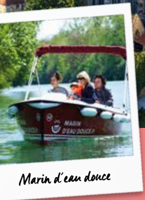
Marin d'eau douce