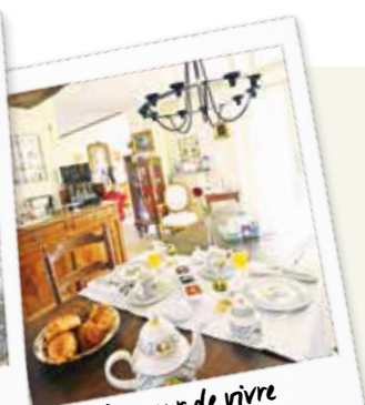
Douceur de vivre à La Pommerie