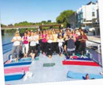
Croisière Yoga sur La Seine