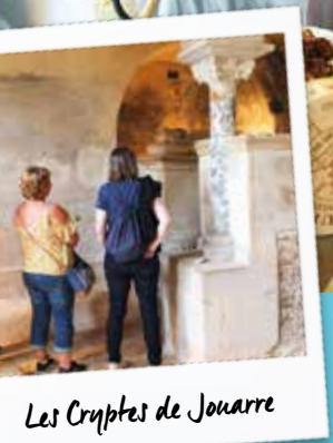
Les Cryptes de Jouarre