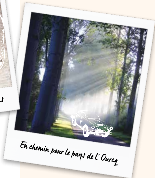
En chemin pour le pays de l'Ourcq

Sylvain a imaginé des hébergements originaux : un tipi, une tente militaire, un voilier... non vous ne rêvez pas ! Les enfants seront ravis et les adultes aussi. Il propose également des balades en chien de traîneau !