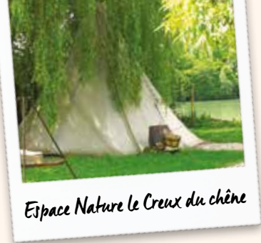
Espace Nature Le Creux du chêne

Maison d'hôtes L'Orangerie Saint-Martin, à Mary-sur-Marne