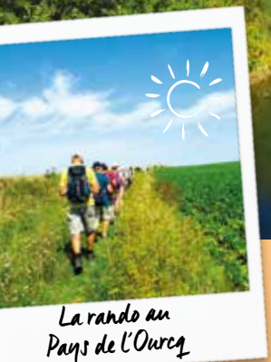
La rando au Pays de l'Ourcq