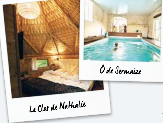
Le Clos de Nathalie