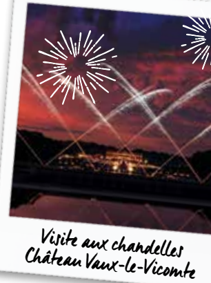
Visite aux chandelles Château Vaux-le-Vicomte

Un château merveilleux, des jardins somptueux, l'œuvre qui a inspirée Versailles. Faites le tour des jardins en voiturette électrique ou préférez une visite à la tombée de la nuit. Plus de mille bougies éclairent tout le domaine pour une soirée romantique (de mai à octobre uniquement).