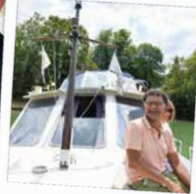
Croisière sur La Marne

Et pourtant de grands artistes contemporains exposent à la Galleria Continua de Boissy-le-Châtel. Oubliez le stress et les idées reçues et venez vivre une campagne riche de tous les goûts de votre vie.