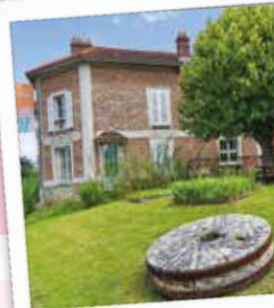
Musée de La Seine-et-Marne

Profitez-en pour visiter le Musée de la Seine-et-Marne à Saint-Cyr-sur-Morin !