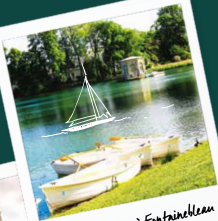
Etang aux carpes à Fontainebleau