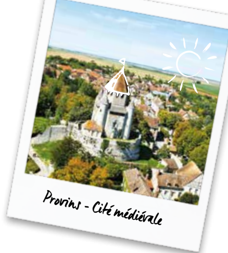
Provins - Cité médiévale