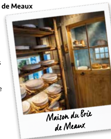
Maison du Brie de Meaux

Au cœur de la gastronomie meloise, affûtez vos sens et découvrez l'origine du célèbre fromage AOP.