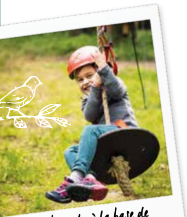
Accrobranche à la base de loisirs de Bois-le-Roi