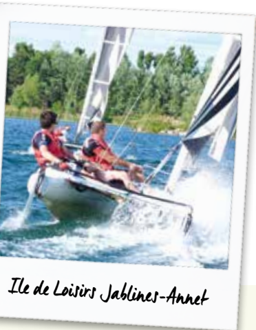
Ile de Loisirs Jablines-Annet

Que ce soit sur l'eau ou sur la terre, la base de loisirs vous propose une multitude d'activités de loisirs : baignade, téléski nautique, mini-golf, planche à voile... De véritables slowXperiences à expérimenter !