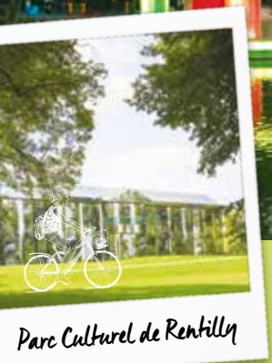
Parc Culturel de Rentilly