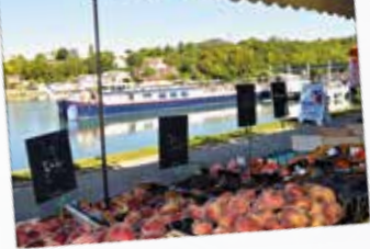
Marché de Saint-Mammès