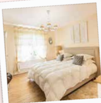
Domaine du Bois des Anges

Dans le loft ou en formule chambre d'hôtes, au bord de la piscine, dans le hammam, au bar ou autour du billard, prenez le temps de souffler et profiter de l'écrin de nature qui s'offre à vous.