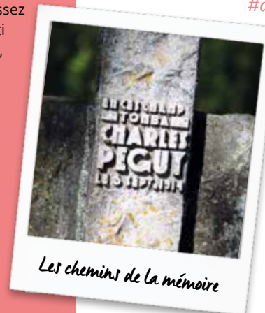
Les chemins de la mémoire

A pied ou en voiture, découvrez les lieux de mémoire qui ont marqué l'histoire de la Première Guerre mondiale et celle du Pays de Meaux. Depuis le musée de la Grande Guerre jusqu'au cœur de la cité épiscopale de Meaux, revivez l'histoire à votre rythme.