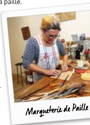
Marqueterie de Paille