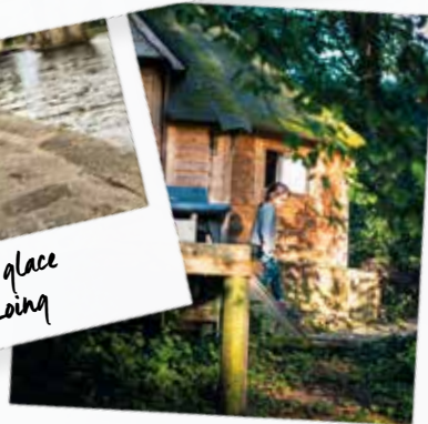
Le Clos de Nathalie